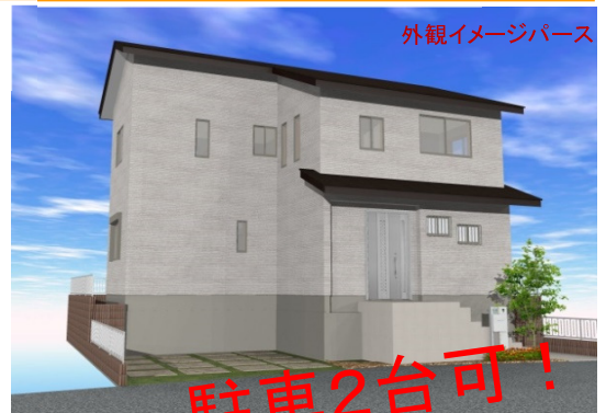
外観イメージパース